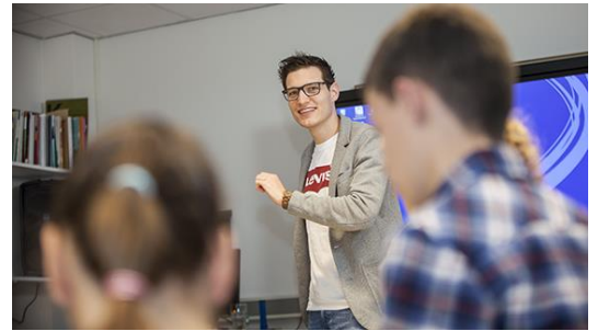
Leerkracht geeft enthousiast zijn les

Mannelijke leerkrachten zijn er niet zo veel in het speciaal onderwijs. Mannelijke leerlingen wel, jongens eigenlijk nog. Als man op de school ben je meer dan een leerkracht. Je bent een rolmodel, vooral voor de jongens. Hierdoor is de band die je opbouwt met de leerlingen vele malen sterker dan in het regulier onderwijs. Je bent een onderdeel van hun leven en helpt ze om belangrijke stappen te zetten op weg naar volwassenheid. Hier haal ik erg veel voldoening uit. En hopelijk jij in de toekomst ook!